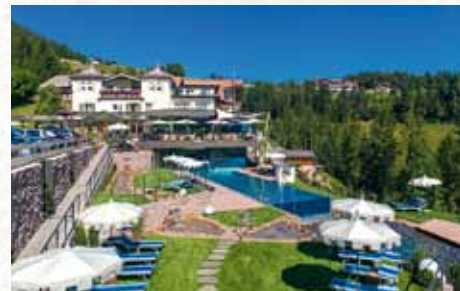
Sieger des Topras Kreativpreis in der Kategorie Hotelbäder

HARMONISCH, ALPIN, CHARMANT... erholsame Ferientage im **** Mountain Spa Resort Hotel Albion!