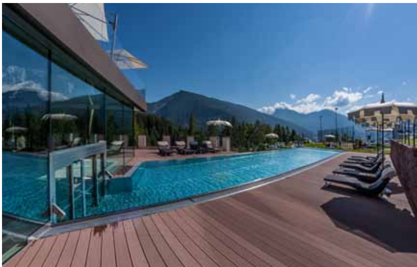
Beim neuen Edelstahl-Pool sind Innen- und Außenbecken durch eine Glasscheibe getrennt.

Das Panorama der Dolomiten ist zum Greifen nah. Grödnertal und die Seiser Alm sind berühmt für ihre tollen Sport- und Freizeitmöglichkeiten. Eingebettet in diese Traumkulisse liegt das 4 Sterne Superior-Hotel Albion am Fuße der Seiser Alm. Das Mountain Spa Hotel Albion ist der ideale Ausgangsort zum Wandern und Mountainbiken, Skifahren und Langlaufen. Das Hotel besticht durch eine stilvolle Kombination von geradlinigen modernen Elementen, klaren Formen und gemütlichem alpinen Interior. Romantische Zimmer und luxuriös ausgestattete Suiten laden zum Entspannen ein. Natürliche Materialien, alpines Design und höchster Komfort sind zu einem einzigartigen Wohlfühlerlebnis kombiniert.