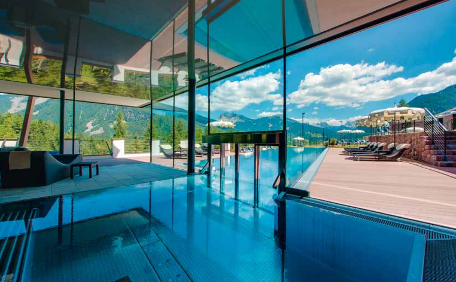
Preisgekrönter Alpine Sky Pool